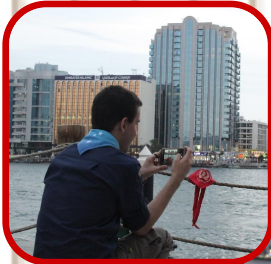
É o Lagoa se fazendo presente no Brasil e no mundo.