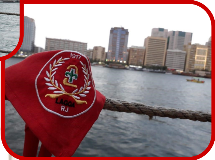
É o Brasil apresentando o melhor do nosso escotismo.